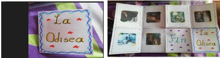
Imagen 3. del fanzine