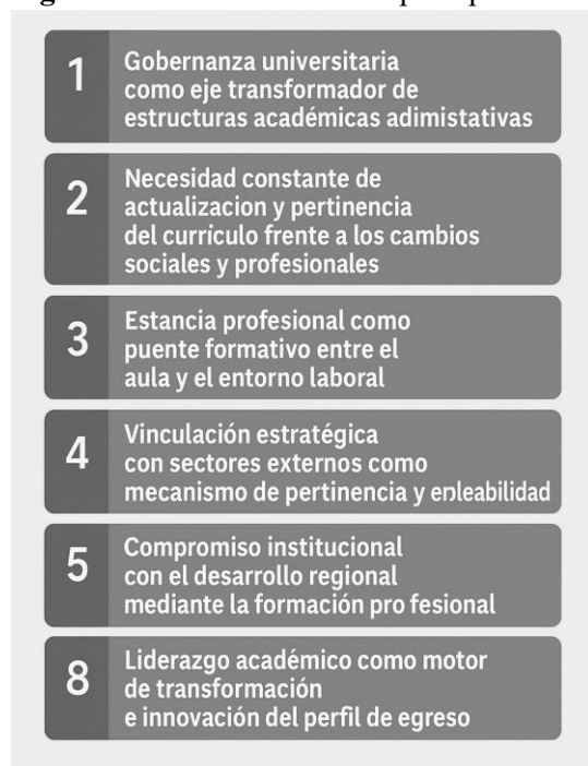
Figura 2. Patrón común en la percepción de exrectores de la UA de O