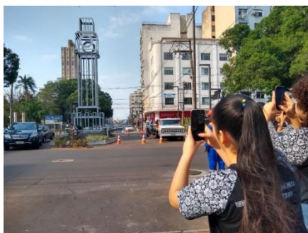
Figura 4. Registro fotográfico de los alumnos.

A continuación en la figura 5 se muestra el estado final del Edificio Nação, construido en 1948, tras su intervención dentro del proceso de revitalización. La imagen evidencia la recuperación de sus valores arquitectónicos originales y su reinserción cualificada en el paisaje urbano contemporáneo. Esta intervención permitió no solo la conservación material del inmueble, sino también la reactivación de su valor simbólico como referente de la memoria colectiva, reforzando el papel del patrimonio edificado como elemento estructurante de la identidad urbana.