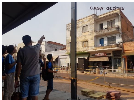
Figura 3. Visita mediada a la Rua 14 de Julho.

En 2019, el proyecto tuvo continuidad en siete de las escuelas participantes. Durante esta etapa, los alumnos recorrieron la ruta de revitalización establecida, efectuando registros fotográficos y realizando observaciones sistemáticas de los elementos arquitectónicos, urbanos e históricos de la calle. El recorrido se configuró como una experiencia activa de exploración del patrimonio, basada en la observación, la interpretación y la reflexión crítica sobre la evolución de la ciudad.