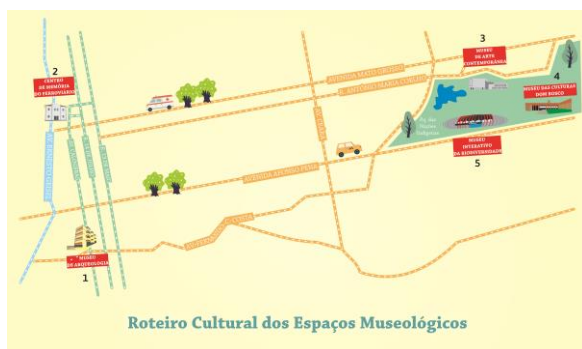
Figura 11. Ruta Cultural de los Espacios Museológicos. Creación: Fernando Trevisan.