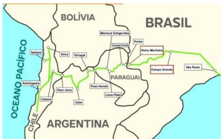
Figura 2. Trayecto de la Ruta Bioceánica. Fuente: Campo Grande News.

Disponível em https://www.campograndenews.com.br/economia/rota-bioceanica-liga-maior-planicie-alagada-do-mundo-ao-deserto-mais-alto . Acesso em 22/06/2024