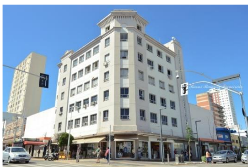
Figura 5. Edificio Nação (1948) tras la revitalización de la Rua 14 de Julho.

Los resultados evidenciaron un aumento significativo del interés de los estudiantes por la historia local y por los valores asociados al patrimonio cultural, así como el fortalecimiento del aprecio por los bienes históricos. Asimismo, los educadores comenzaron a integrar con mayor frecuencia los contenidos patrimoniales en sus prácticas pedagógicas, utilizando el entorno urbano como punto de partida para comprender procesos históricos, sociales y territoriales más amplios. Estos resultados confirman el potencial de la educación patrimonial como instrumento de alfabetización cultural y de formación ciudadana. También, la revitalización de la Rua 14 de Julho permitió, además, consolidar el patrimonio como herramienta para el desarrollo local. En este contexto, se reafirma la necesidad de comprender el desarrollo sostenible a partir de la articulación entre personas, medio ambiente y cultura (Ver figura 6),