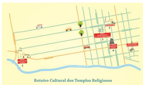
Figura 10. Ruta Cultural de los Templos Religiosos. Creación: Fernando Trevisan.

Respecto a la ruta de los templos religiosos permite comprender la formación histórica de Campo Grande a partir de la dimensión espiritual y simbólica del territorio. Incluye la Igreja Matriz de Santo Antônio, Igreja São José, Igreja Presbiteriana Central, Igreja Evangélica Batista e Igreja São Francisco de Assis (Ver figura 10).