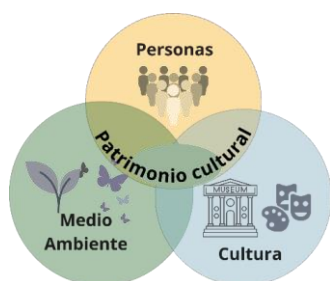
Figura 6. Trípode personas, medio ambiente y cultura.

sustentada en modelos de gobernanza que integren planificación urbana, participación social y educación patrimonial.