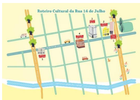
Figura 7. Ruta Cultural Rua 14 de Julho . Creación: Fernando Trevisan.