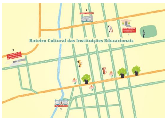
Figura 9. Ruta Cultural de las Instituciones Educativas. Creación: Fernando Trevisan.