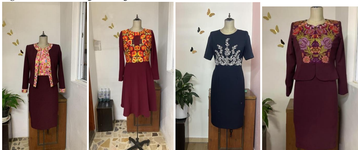
Figura 14 Archivo fotográfico-digital de la diseñadora