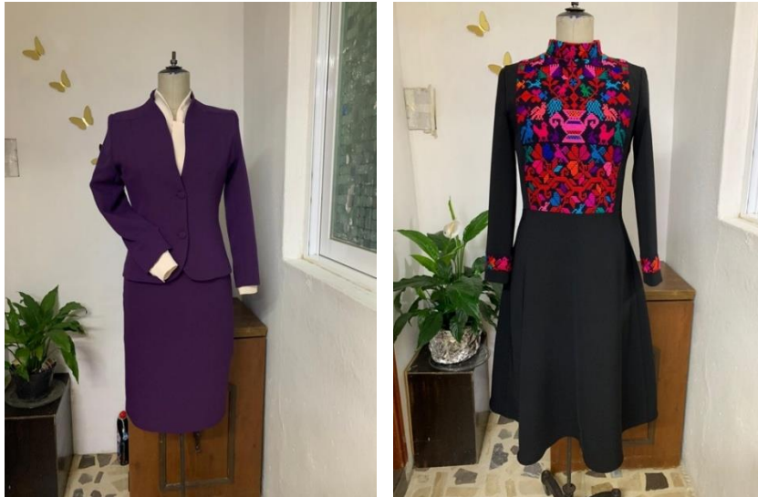
Figura 12

Algunas de estas prendas que pueden observar aquí exhibidas en los del taller de San Pedro Mártir, los podemos recordar en visitas a los distintos estados de la república, en las mañaneras o eventos internacionales.