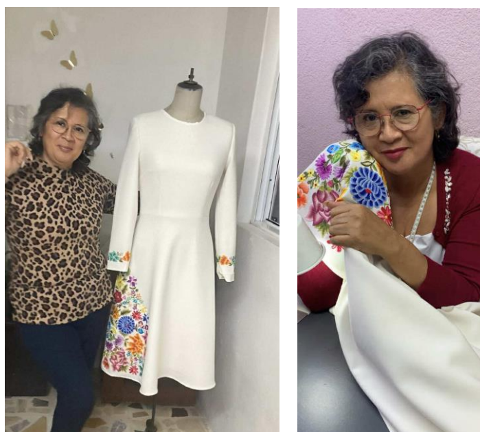
Figura 21 Archivo fotográfico-digital de la diseñadora

Se expresa con mucha admiración de la presidenta, ser parte del equipo, aportando en lo que puede en esta historia del vestir a la presidenta para ella tiene un significado sumamente especial. En algún momento de la conversación menciona que es como una presidenta humilde, nos comparte que reutiliza algunas de las prendas para hacer nuevos estilos de vestidos o trajes sastre. A la pregunta de si alguna de las casas de moda internacionales habrían buscado a la presidenta para vestirla, me dice que la representante de la cuarta transformación no habría querido seguir esa ruta.