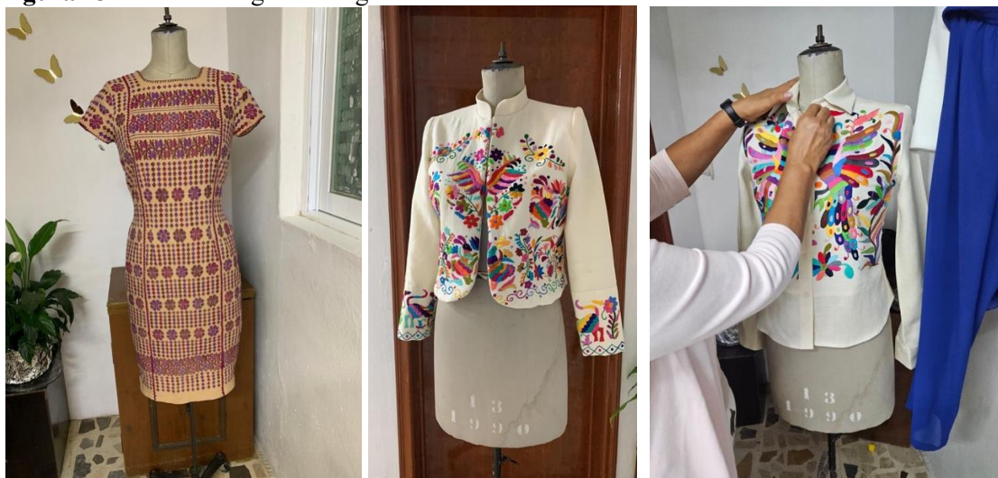
Figura 13 Archivo fotográfico-digital de la diseñadora

A continuación, desfilan trajes sastres y vestidos en distintos colores y bordados de algunas regiones de la república mexicana.