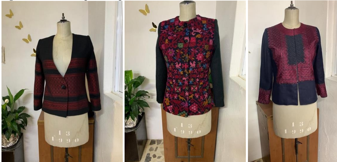
Figura 16 Archivo fotográfico-digital de la diseñadora

El 1 de octubre del 2024 la presidenta electa Claudia Sheinbaum Pardo tomó protesta como presidenta de México frente al congreso de la unión. Portó un vestido aperlado, color ivory, en corte A, con bordados de flores en puños y parte de abajo del vestido de la diseñadora y bordadora zapoteca Claudia Vásquez Aquino. Imagen que recorrió los medios internacionales.