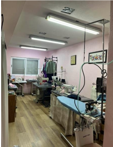
Figura 7 Fotografía del Archivo personal de Olivia Trujillo.

Sus nietas aparecen en las imágenes siguientes, reconoce que Isabella es muy buena para ello.