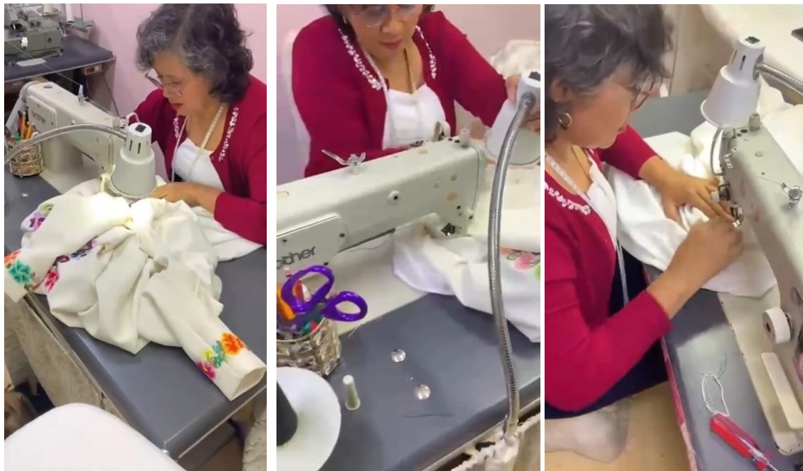
Figura 20 Proceso de confección vestido presidenta Claudia Sheinbaum Pardo.

En las siguientes imágenes podemos abrir la puerta de parte de su taller en San Pedro Mártir, en dónde se dio el proceso de confección del vestido.