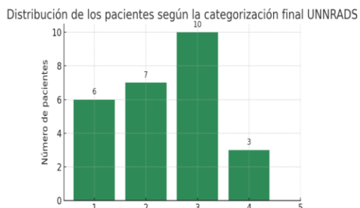
Figura 2. Distribución de los puntajes UNNRADS en la cohorte estudiada